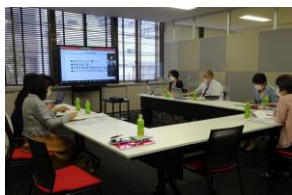
一県薬剤師会館に新設された 情報センター室から初めて発信