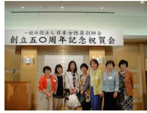
一般社団法人日本女性薬剤師会 創立50周年記念祝賀会