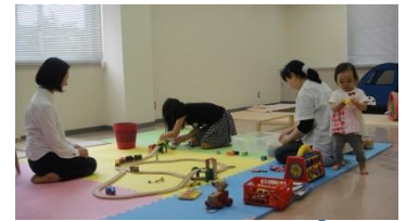
講習風景とキッズルーム