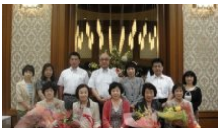
感謝状受賞者を囲んで